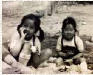
一見、仲良さそうですが…。

そんな姉とも大人になった今は、さすがにケンカもしませんし、買い物やランチに行き「田名の美人姉妹」の昔話に花を咲かせ、好き勝手なことを言っていて楽しんでいます。