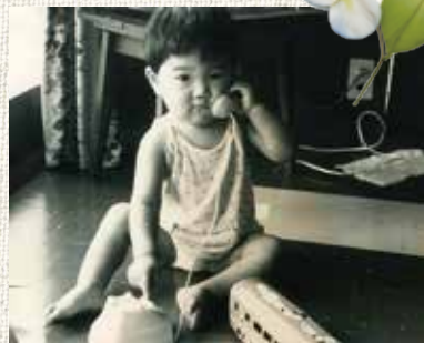
電話する姿は今と全然変わらないと、スタッフの間でもっばらの評判です。

ボクの名前、「康宏」の「康」はまずは健康でいてほしいという両親の願いから。そして「宏」は心はひろくあってほしいという想いからだそう。そこで名前では使われる事を見たことのない漢字「宏」について調べてみると、同じ広いでも、三次元的な広さ、拡がりや、建築などで奥行きのあるような広がりを感じます。