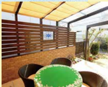
強い陽射しにはココマの日除けを閉めて。