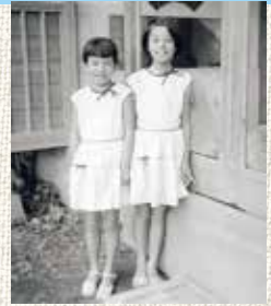
お揃いのワンピースで妹と。

私の子供の頃という、昭和二十年代から三十年代初め、今とは全く様相の違う時代です。私が幼かった頃には、タライで洗濯をし、七輪で煮