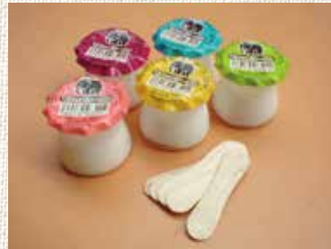
サンヨー製菓のモロッコヨーグル。でも実はヨーグルトではありません。

ゴムボール野球にキックベース、缶蹴りにケイドロなど私が小学生の頃に夢になった遊びです。昭和55年から60年頃が外で遊ぶことが何よりも楽しかった時代です。よく駄菓子屋さんに100円持って、10円や20円のお菓子を買いに行ったものです。私が好きだったのはモロッコヨーグルとハートチップル。この名前を聞いてピンとくる人は私と同年代か少し上の世代の方でしょうか。とにかく外で遊んだり駄菓