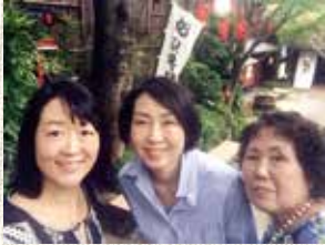
今では良い思い出です。右は母。

そんな姉とも大人になった今は、さすがにケンカもしませんし、買い物やランチに行き「田名の美人姉妹」の昔話に花を咲かせ、好き勝手なことを言っていて楽しんでいます。