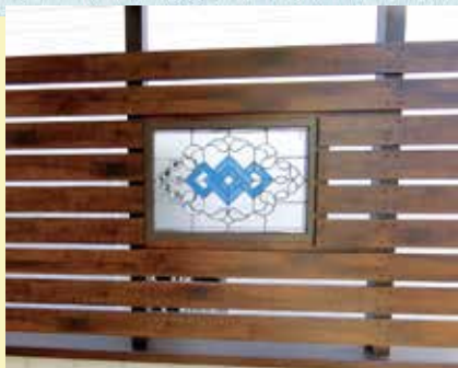
お手持ちのスタンドグラスをはめ込み。