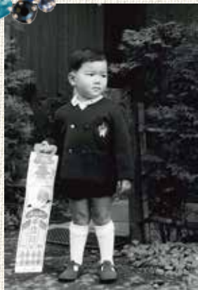
まるで「少年よ、大志を抱け」。 千歳飴を持って七五三。

生まれて一番最初に与えられるものの一つが名前。実は映画を観たいと思っただけの一つは、自分の名前の由来なんです。