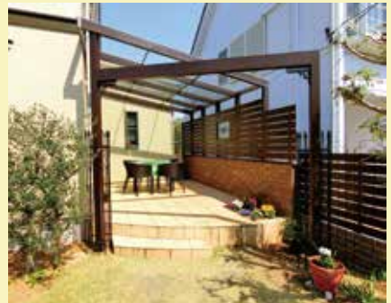
フレームにはバラを誘引するそう。