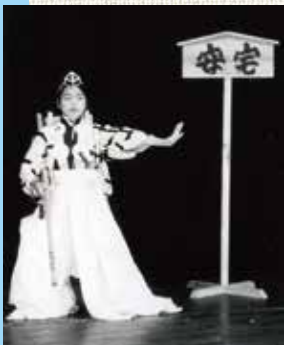
オペレッタ「勸進帳」の弁慶役。

小さいころは虚弱体質、内気で幼稚園も中退する程でしたが、小学校に入りだんだんと丈夫になり、また活発にもなっていたようです。走るといつもビリだった私は、運動会は苦手、学芸会は出番も多く楽しみでした。外より家の中で遊ぶことが多かったかもよく覚えているのはキューピー人形の部屋を空き箱で作り、マッチ箱を重ねてタンスにしたり、また、端布でスカートを作り着せて遊んだこと。ある物を利用して、工夫して創る事が楽しかったんですね。今の「シルビアファミリー」の立派なハウスを見る度に思い出します。物は無くても心は豊かな時代だったと、今改めて思います。