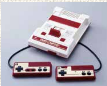
任天堂ファミリーコンピューター。近頃小さいタイプの復刻版が出ましたね。

今は子供もスマホでゲームをする時代ですよ。ね。本当は外で遊んだり駄菓子を買って行った方が楽しいんだけどなあ…。