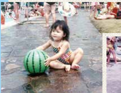
夏は毎年、鷺沼プールガーデンと三浦海岸に行っていました。