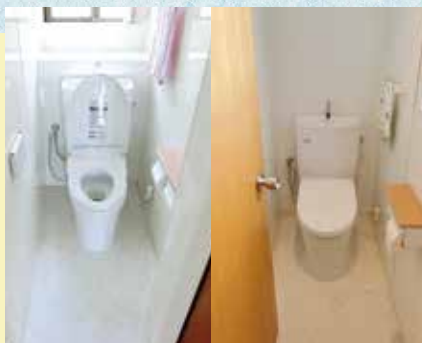
2箇所のトイレをそれぞれリフォーム。