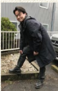
お休みの日は絶対履きます。

癖ともいえないかもしれませんが、僕は靴を買いに行くとき、なぜかハイカットの靴に惹かれてしまうんです。あの形がとても好きなんです。そして、座敷の店に行ったら靴を脱ぐ時にひと苦労、なぜこの靴で来てしまったんだろうと後悔・焦って脱ぐと靴下もろとも脱げてしまうなんていう恥ずかしい事もしょっちゅうなんです。でもやっぱり、ハイカットの靴にばかり目がいつてしまうんです。すよね。