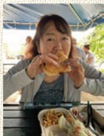
食べている時が一番幸せです。よね♡

何年か前にはモリモリ食べることから「ゾウさん」なんて可愛らしいあだ名までいただいたこともあるのに、食べられなくなるものです。なんだか寂しいです。それでも、次の友達とのランチ先を食べ放題のあるお店で検索中。ついワクワクしながら探しています。これって癖ですよね。全く懲りないです。