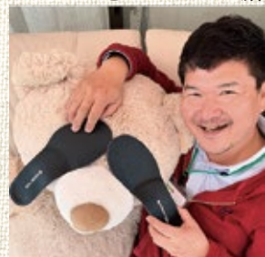
入稿後にインソールが届きました！

らったところ、「右脚に比べ、 左脚が少しだけ長いようですね。 また、歩く際に体重が足の外側を移動してい て、うまく歩けているとは言いがたい」との 診断。そうか、左足首を折るクセは、左右の 脚の長さの違いが原因だったのか。と納得し たボクは、翌日も再訪して結局インソールも オーダーしちゃいました。測定した3次元の データを元に京都の熟練の職人さんが作成す るそれは一カ月以上かかるこのことで、楽し みに待っています。 それからというもの、人の足元を見るのが クセになっちゃいました。あれ、言い方が良 くないぞ（笑）。人の靴の減り方を見るよう になったのです。人によって靴の減り方はず いぶん違い、その人の歩き方や荷物の持ち手 を見て、いろいろ考察して楽しんでいきます。 ところで東神ハウスのクセってなんだろう？ 中から見てみるとわかりにくいけど、お客さ まの声を頂いて気が付くこと、喜ぶことがた くさんあります。ぜひ、工事後の「アンケ ート」や、この笑顔 満庭の「何か一言」 から、元気になるビ タミンを注入くださ いね！