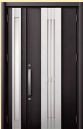
リフォームドア「リシェント玄関ドア」(LIXIL)

大変だと思っていた玄関ドアの取替も外装や内装を傷めずに1日で完了! もちろん強力な防犯機能で安心も手に入ります。