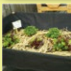
リーフレタス & パセリ

このコーナーが始まって、約1年が経ちました。 その間に17種類ほどの野菜を育てました。ご紹介します。