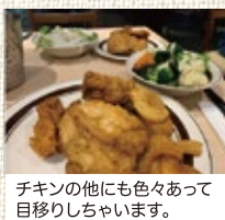
チキンの他にも色々あって目移りしちゃいます。