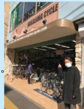
このお店で買うことに決めました！！

ネットでまず勉強、お店もホームセンター・大型自転車販売店と見て回り、最後に行き着いたのはスポーツバイクに力を入れている専門店。女性の店員さんがとても熱心に色々教えてくれました。というわけで購入するお店と自転車は決定。 自転車はブリヂストンのクロスバイク、シルヴァF24にします！ 次号でお披露目させていただきますので楽しみにしてください。 スポーツバイクをおすすめいただいたO様、申し訳ありません。 初心者の僕は、まずこれくらいから始めさせていただきます。 いつかスポーツバイクでツーリングしましょう！