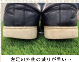
左足の外側の減りが早い・・・

「気をつけ！」子供のころから幾度となく かけられるこの号令に、「ピッ！」ときれ いな立ち姿で直立不動。あれ？最後に「気 をつけ」の号令を聞いたのはいつだったか な・・・。 その号令を聞かないせいではないけれど、 立ち姿の際、いつも左足首を少し外側に 折る自分のクセに気が付いたのは数年前。 人間の身体左右対称ではないし、あまり気 にはしなかったけど、考えてみると靴底の 減りも必ず左足の外側から。そしてヒザの 違和感の原因のひとつかも。（もちろんそ の主たる理由は体重と運動不足だって知っ ていますよ・・・笑） なんて考えていたら、 意識とはアンテナのよう なもので、必要な情報が 寄ってきます。 ふと立ち寄ったスポーツ用品店。立っ ている時の体重のかかり方や、歩く際、ど のように体重移動しているかなどの測定会を しているのでも試してみませんか。との誘 い。その先にはオーダーインソールの販売 会がセットなのだけど、興味を持ったボク は測定台の上で立ったり歩いたりを繰り返 し。そもそもの身体のクセや、歩く時にう まく足が使えているかどうかなどを見ても