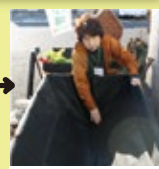
専用シートを被せます