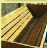
空になったベジトラグ