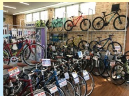
こんなにたくさんの種類が・・・

すみません・・・昨年のうちに自転車を買うと宣言していたのに、まだ購入出来ていないんです。言い訳をさせて下さい。 僕は本当に自転車についてど素人でした。スポーツバイクも普通の自転車を買うのと同じで、お店に行ってどれにしようかなあと考え、すぐに決定。 その日のうちに乗って帰れるくらいに思っていたんです。 ですが、店に行ってみるとその種類の多さ、フレームの素材・タイヤのサイズ・ギアの数、こんなに種類があるとは・・・メーカーもたくさんあり、とてもすぐには決めることが出来ませんでした。