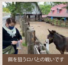
餌を狙うロバと犬の戦いです

牛・羊はもちろん、馬、ロバ、オウム、牧羊犬、ヤギ、ニワトリ、七面鳥、ウサギ、まだまだいるのですが、書ききれませんwとにかく動物がいっぱい!牧場ですし、係員さんがいたりはいない料金も形態もフリーな空間。日常の牧場を垣間見れるのが楽しいです。ふれあいなどはありますが売店で販売されている餌を一部の動物にあげられます。