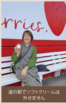
道の駅でソフトクリームは外せません

最近のお気に入りには寒川にある「わいわい市寒川店」です。新鮮な野菜や果物の他に、「花の町寒川」のキャッチフレーズがあるとおり、花の苗や切り花が豊富で、実家の仏壇用に買って帰ると母が「鮮度が良くて持ちが良いのよね、わあ、嬉しい」と言っていて、とても喜んでくれます。定期的に通っている歯医者もすぐ近くにあり、帰りに必ず寄りたいたいのですが、わいわい市と東神ハウスの定休日がどちらも水曜日なので、わいわい市の方が定休日を