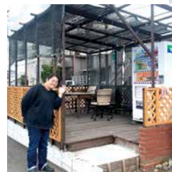
▲テーブル席もあります

「子供たちに安心して食べさせてあげられるハンバーガー」をテーマに作られたハンバーガー。パテはおからパウダー入りで、ふわっふわ！しっかりした味と肉感も楽しめる絶妙さです。「お肉の味を楽しみたくて、テリヤキ風のソースなしで召し上がるお客様もいらっしゃいますよ」と店長さんが話してくださいました。子供価格の設定がある「出世払いで食べられる」という、メニューから価格まで子供思いな優しいお店です。良さを書ききれませんので、ぜひ行ってみてください。営業日は火曜日と木曜日のみ。臨時休業などの案内もされているので、Instagramでご確認の上おかけください！そしてお向かいの東神ハウスにもぜひお立ち寄りください^^