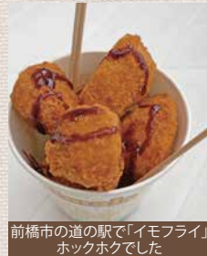
前橋市の道の駅で「イモフライ」ホックホックでした

私が大好きな場所、お気に入りです。旅行やドライブ途中で見つけると必ず、いえ、絶対に寄ります。そしてウロウロとお店の中を行ったり来たり。朝採れの新鮮な野菜や果物、その土地の方が作ったお饅頭やお惣菜が並べられています。また、観光地