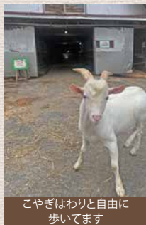
こやぎはわりと自由に歩いています

とっても楽しいので「某母親牧場にはもう行けないなあ(笑)」と娘と話してました。近くて安くて楽しい!です。