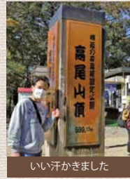
いい汗かきました

お気に入りの場所のひとつ、それは高尾山です。年に一度ですがほぼ毎年登ってますよ。