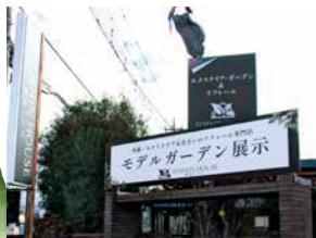
▲交差点の看板も変わりました