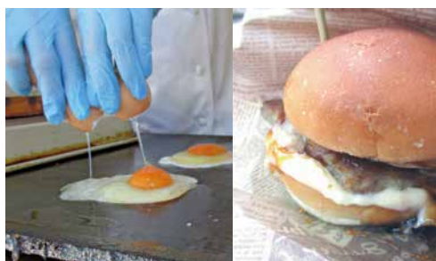
▲体にいいものだけで作られたふわふわハンバーガー！

YOLO BURGER 住所:相模原市南区麻溝台5-1-21 東神ハウス向かい (駐車場あり) 営業日時:火曜日・木曜日のみ 11:00~17:00