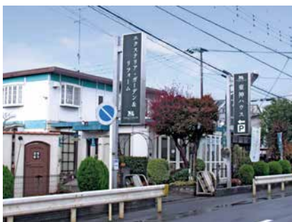
▲駐車場の入口もわかりやすいようにしました