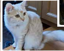
▲ おてんばな紅一点のめいちゃん