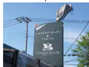
▲新しいロゴに/でも・・・左上に・・・?