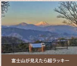
富士山が見えたら超ラッキー

途中の薬王院にお参りも出来て、天狗焼きなど美味しい名物もおやつに食べることが出来ます。景色もとてもきれいで、すごく気持ちいいんですよ。マイナスイオンも思いっきり浴びることが出来て、気分転換には最高です。そして、麓に帰ってきたら、これもまた名物の