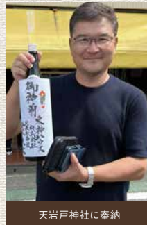
天岩戸神社に奉納

後お参りするまでの少しの緊張と、その後優しい空気に触れられるような感覚で境内を散歩する時間はとても気持ちのいいものです。季節の変わり目のご挨拶や旅先での立ち寄りなど、訪れる機会と場所が年々増えてきました。