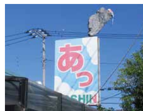
▲おなじみの「あっ」の看板も・・・

これからも皆様の快適な暮らしのお手伝いができるよう頑張っておりますので、応援よろしくお祈りします。