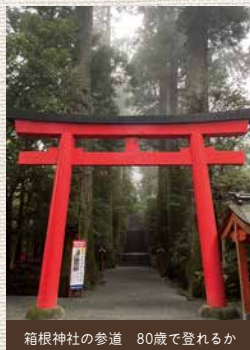
箱根神社の参道 80歳で登れるか

ご縁があって鹿児島、知覧特攻平和会館に行く機会に恵まれました。せつない展示の数々に涙し、英霊に感謝の念を捧げつつ、これからの時間を大切に生きようと思わずにはいられませんでした。